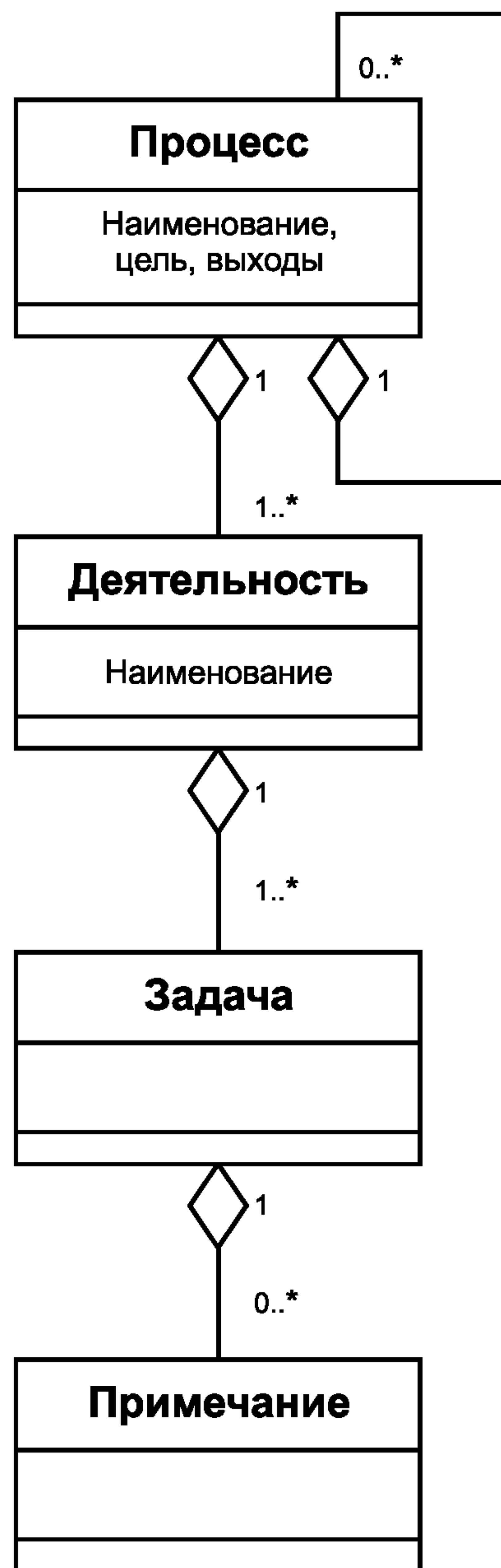
Рисунок С.1 — Конструкции процессов в ИСО/МЭК 12207 и ИСО/МЭК 15288

Примечания используются, если появляется необходимость в поясняющей информации для лучшего описания содержания или структуры процесса. Примечания обеспечивают понимание, относящееся к реализации или области применимости, такой как списки, примеры и другие представления